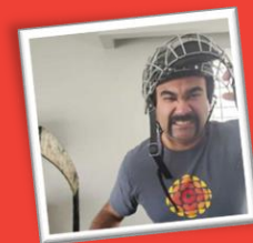
Saket - Finances

Consultez leur page de collecte de fonds pour voir leurs résultats étonnants!