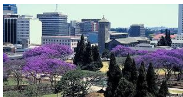
Le flamboyant bleu à Harare