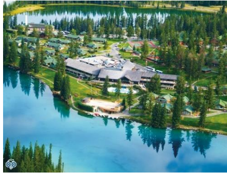
Jasper Park Lodge