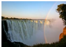
Les chutes Victoria

Mes parents ont décidé de s'installer au Canada, ma famille s'est donc établie à Toronto à la fin des années 70. Durant mes études secondaires, je travaillais dans des restaurants pour gagner de l'argent. C'est comme ça que la restauration est devenue pour moi une véritable passion. En toute logique, j'ai donc suivi des études universitaires en gestion de l'accueil et du tourisme à l'Université Ryerson... quatre années passionnantes! Encore aujourd'hui, j'entretiens des liens avec Ryerson. Nous y offrons le programme annuel de bourses d'études de Bento pour les étudiants en tourisme et hôtellerie.