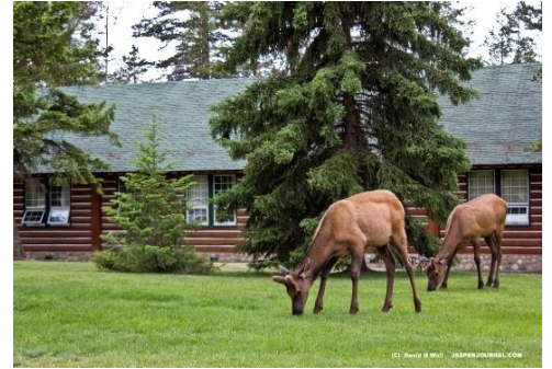
Mon cabanon à Jasper

Alors que je lisais le journal pendant ma pause déjeuner à l'hôtel Four Seasons, j'ai vu une annonce où on recherchait des professeurs d'anglais pour aller travailler au Japon et j'ai décidé de postuler pour vivre une nouvelle expérience et visiter un nouveau pays que j'ai toujours voulu découvrir. Cela a été l'une des plus importantes décisions que j'ai pu prendre dans ma vie et que je ne regretterai jamais.